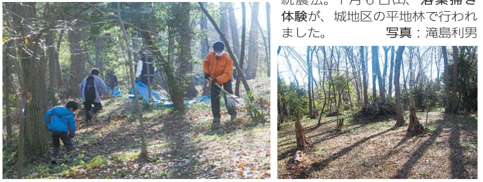
▼日本農業遺産「武蔵野の落葉堆肥農法」は、江戸時代から続く伝統農法。1 月 6 日(土)、落葉掃き体験が、城地区の平地林で行われました。