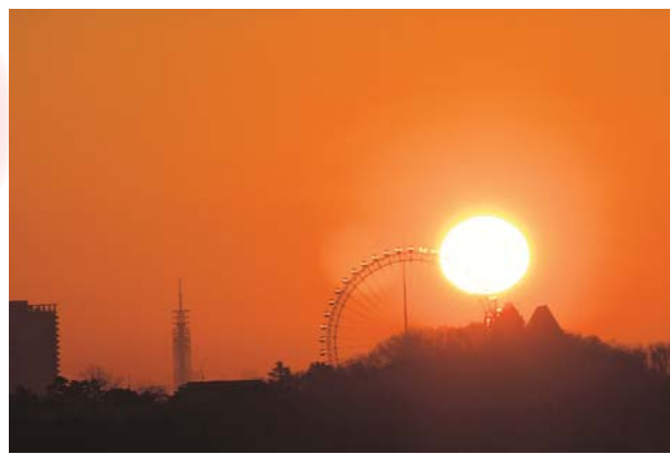
▲初日の出 狭山湖から見た初日の出は、観覧車と重なってダイヤのリングみたい！ ●べすとまっち（山口）