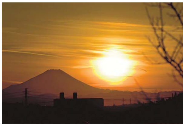
▲所沢から見る夕日 よく見ると、シルエットがところんの顔に見えるのは私だけ？ ●一写おじさん（上安松）

▶ hiroba@city.tokorozawa.lg.jp 〒359-8501 広報課みんなのひろば