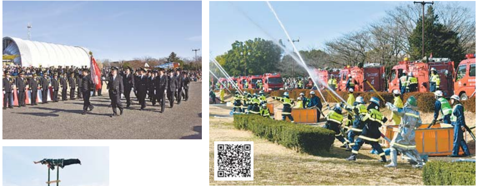
▲ 1 月 7 日(日)、新春恒例の消防出初式在所沢航空記念公園で行われました。勇壮な徒列行進や放水訓練、青空を背景に繰り広げられるはしご乗りの鮮やかな技に、大勢の来場者が拍手を送りました。写真：宮川雄也 動画：笠原政男