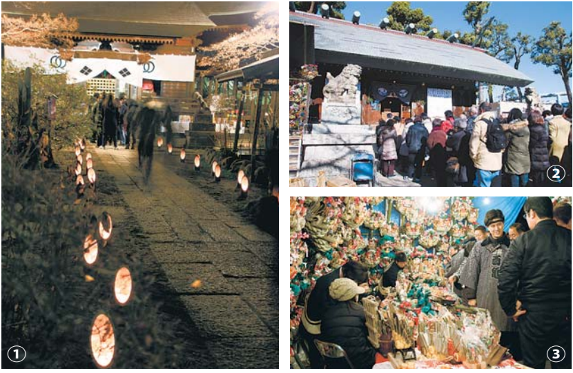
▲ 1 月 1 日(祝)、新年が明けると、市内の寺社は初詣の参拝客でにぎわいました。①多聞院では無数の竹灯籠に火がともり、人々を迎えました。②③④所澤神明社では、日本一早い熊手市で威勢の良い掛け声が飛び交いました。