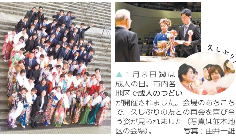
▲ 1 月 8 日(祝)は成人の日。市内各地区で成人のつどいが開催されました。会場のあちこちで、久しぶりの友との再会を喜び合う姿が見られました(写真は並木地区の会場)。