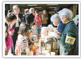
▲一緒にフォーラムを盛り上げましょう！

ボランティア参加者の感想 ボランティア初心者でも安心して参加できました♪ ボランティアしながらも積極的にイベントを楽しめました！