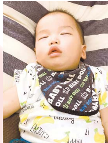
▲ぐっすり～ 気持ち良さそうに寝ている無防備な顔がたまりません ●8888 あみつぱち（東所沢和田）