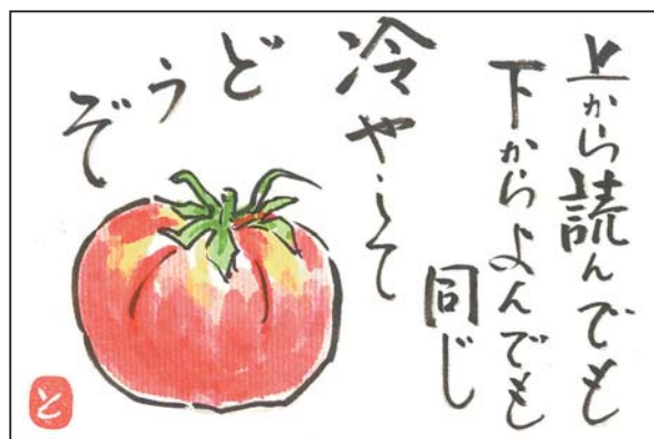
▲トマト おとととーマト丸かじり！ ●仲敏夫（山口）