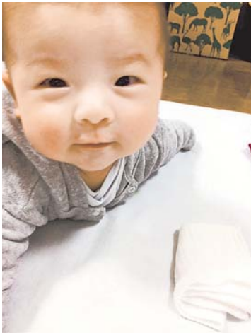
▲できたっ！ 寝返りに成功して、うれしい顔♪ ●みーママ（小手指町）