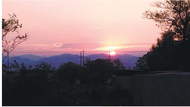
▲夕日 ベランダから見た夕日です。いつまでも見ていたかったけど、すぐに沈んでしまうからなおさら美しい ●はるのん(三ヶ島)