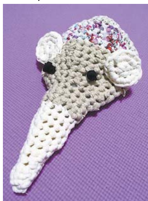
エコだ象(編み物) 着なくなったTシャツを切って糸状にし、編んで象のぬいぐるみを作りました! ●よし(小手指南)