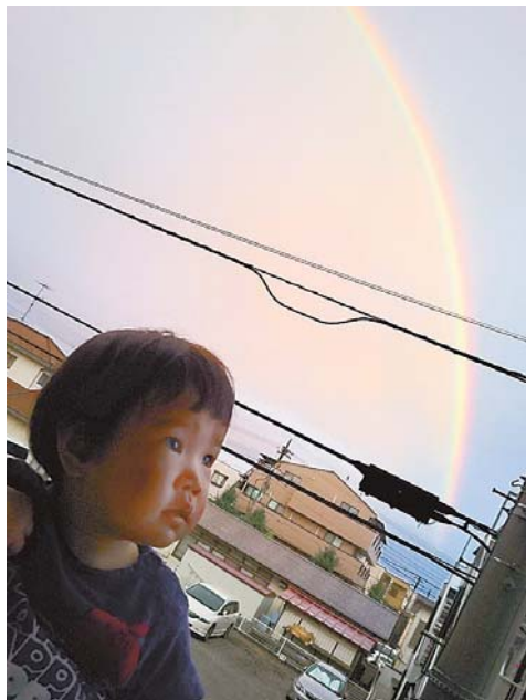
◀虹を見たよ 初めて見た虹はとってもキレイでした ●387(東所沢)