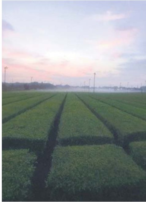
◀朝もやの茶畑 大雨の翌日の早朝、仕事で通るいつもの茶畑がとても幻想的でした ●早起きラッキー(北岩岡)