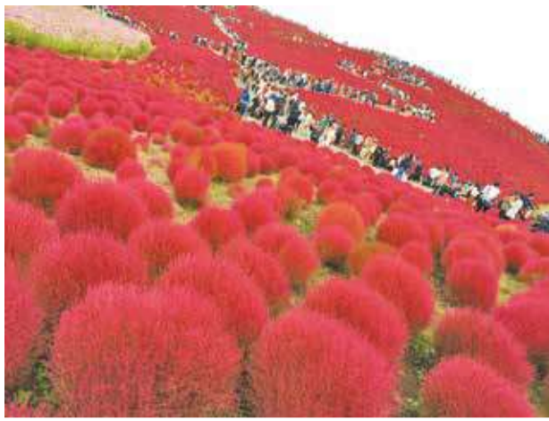
▲魔法の真っ赤なポコポコ 10月中旬になると、緑から真っ赤に変化するコキア。茨城県のひたち海浜公園の雄大なコキアの丘も一面真っ赤で、見ものです! ●ようこ (上安松)