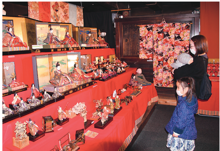
▲2月14日(日)からの1カ月間、所沢駅西口から元町コミュニティ広場にかけて、野老澤雛物語を開催中。店先のひな人形や街中にあるアマビエおひなさまのポスター、野老澤町造商店では時代ごとのひな人形も見ることができます♪