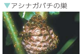
▼アシナガバチの巣

巣を見つけたら、ハチを刺激しないように形状を確認してください。巣に近づき過ぎるのは危険です。スズメバチの巣の駆除は危険度が高いので、専門業者に依頼することをおすすめします。アシナガバチの巣は、日没後に、長袖を着て専用の殺虫剤などで自分で駆除することができます。