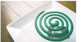
◆蚊に刺されない 蚊が多い場所では、できるだけ肌の露出を避け、足首など小さな露出面にも虫よけ剤などを使用しましょう。蚊取り線香やスプレータイプの殺虫剤なども必要に応じて使いましょう。

◆蚊を増やさない 蚊は、植木鉢の受け皿やプラスチック容器などに溜まる雨水など、小さな水たまりでも発生します。家の周囲の水たまりをなくしましょう。