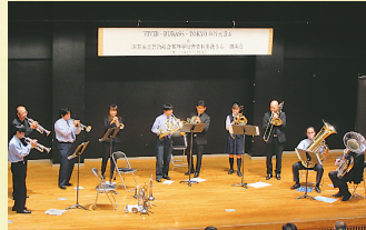
▲迫力ある演奏に感動!

地域の一体感を自然と生み出す音楽。これからも協議会は、公民館事業と協力しながら、美しい音色が響く元気な地区を目指し、活動していきます。