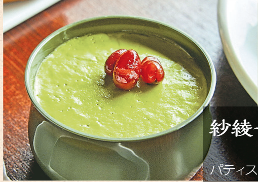
紗綾～Saya～ シリーズ パティスリー ラリベルテ ☎2998-7001