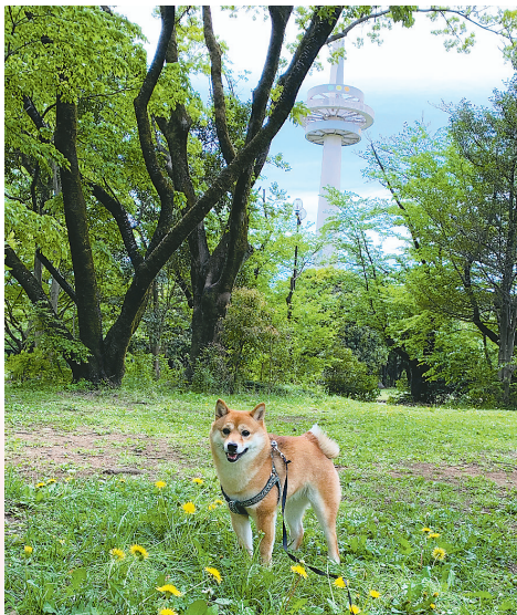
▲散歩道 「あれはスカイツリーですか？」 「いいえ、アレは航空公園の放送塔です」 ●たんぽぽ（美原町）