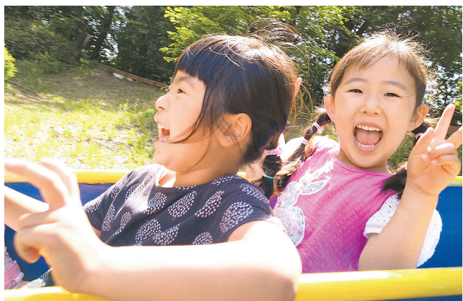
▲二人で乗れば 近所のすべり台もジェットコースターになっちゃうよ！ ●ふたりはともだち（北所沢町）