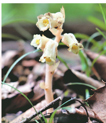
▲雨にも負ケズ、コロナにも負ケズ 埼玉県の準絶滅危惧種に指定されているシャクジョウソウを狭山丘陵で発見。生い茂る緑の足元で、力強く背を伸ばしていました。 ●ひねもすのたり（久米）

▶ hiroba@city.tokorozawa.lg.jp 〒359-8501 広報課みんなのひろば（住所不要）