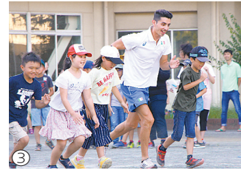
③児童と競争するスタノ選手 ④エールの言葉が書かれた国旗。国旗を中央で持つのがパルミザノ選手（令和元年8月）

男子20km競歩のマッシモ・スタノ選手と女子20km競歩のアントネラ・パルミザノ選手も、それぞれ金メダルを獲得。2人は平成30年・令和元年にも所沢で事前合宿を行い、その際に美原児童クラブの児童たちと交流（写真③）。大会のゴール地点では、プレゼントされた寄せ書き入りの国旗（写真④）を掲げ、所沢との絆をアピールしてくれました。