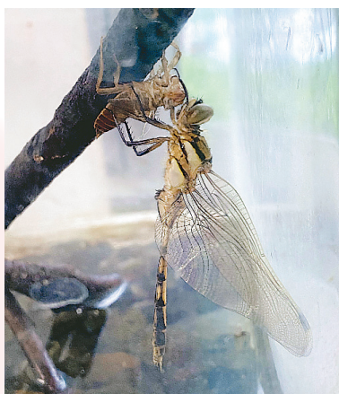
◀ ヤゴからトンボに変身 飼っていたヤゴが朝、トンボになりビックリ！生命の神秘を感じます ● スマイルののちゃん（東所沢）

▶ hiroba@city.tokorozawa.lg.jp 〒359-8501 広報課みんなのひろば（住所不要）