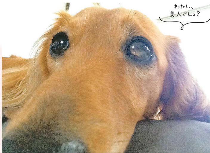
▲ どアップ、自信あり！ 我が家の永遠のアイドルはどアップにも動じません ● ノエルっち（上安松）