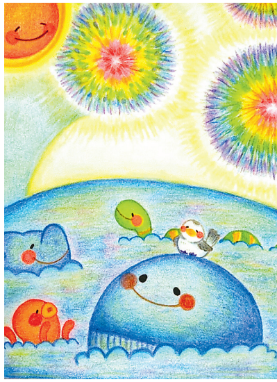
▶ 昼間の花火 花火を見る機会がなかったので、昼間に上がったらどうなるだろうと想像しながら描いてみました。皆様に少しでも夏の疲れを癒してもらえたら嬉しいです♪ ● もぐちゃん（松郷）