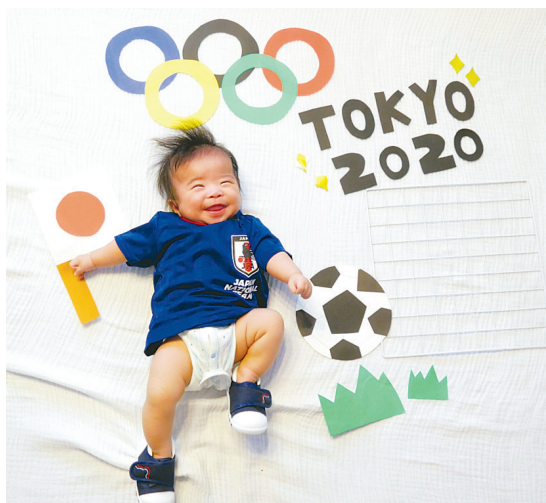
▲ TOKYO 2020 オリンピック出場選手の皆様、感動をありがとうございました！4カ月の息子もテレビの前で応援していました♪ ● リート選手（山口）