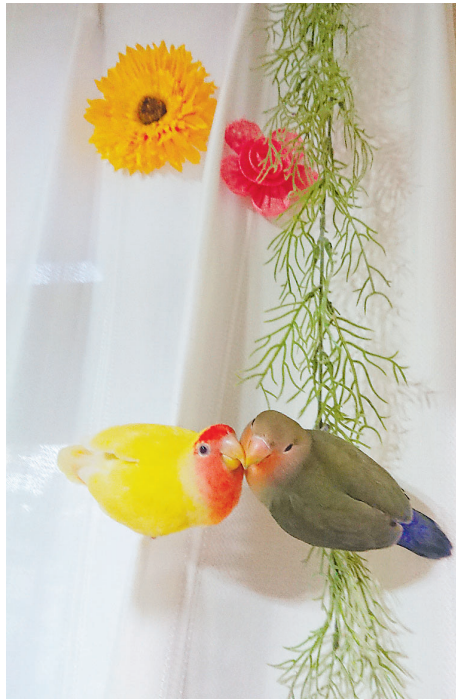
▲ラブラブなふたり 時々けんかもするけれど、 いつでも一緒だよ！ ●ちゅうたろう（若狭）