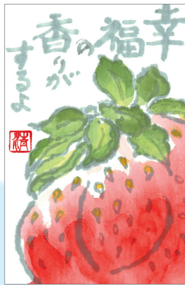
▲春だよ！苺だよ！ 甘い香りに包まれて 思う存分食べたいな ●宇佐美（東所沢）