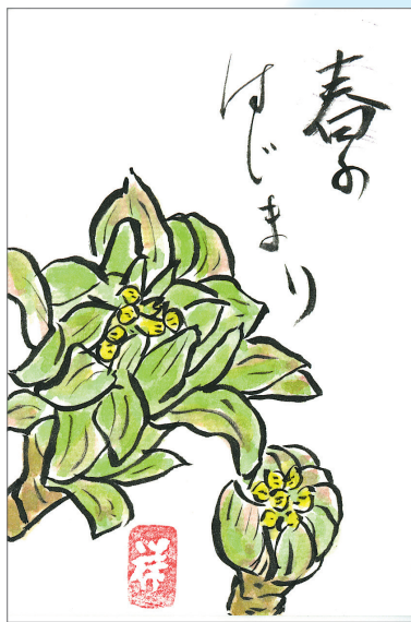
◀春一番 車庫の裏で小さい春、 見つけました♪ ●らぶりん（荒幡）