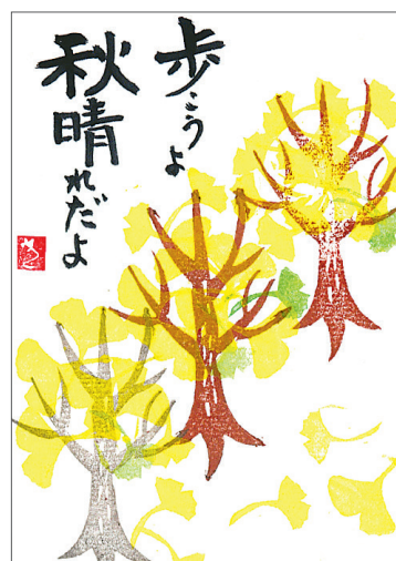
▲歩こうよ 航空公園の散歩道。歩いて気分をリフレッシュ！ ●宇佐美清子（東所沢和田）