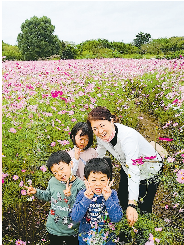
▲コスモスの迷路 コスモス迷路で秋を楽しく感じる事ができたよ♪ ●フォレスト（下安松）