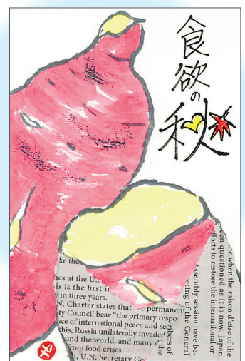
▲所沢産サツマイモ 焼き芋にして、心も体もホックホク ●山たろこ（中新井）