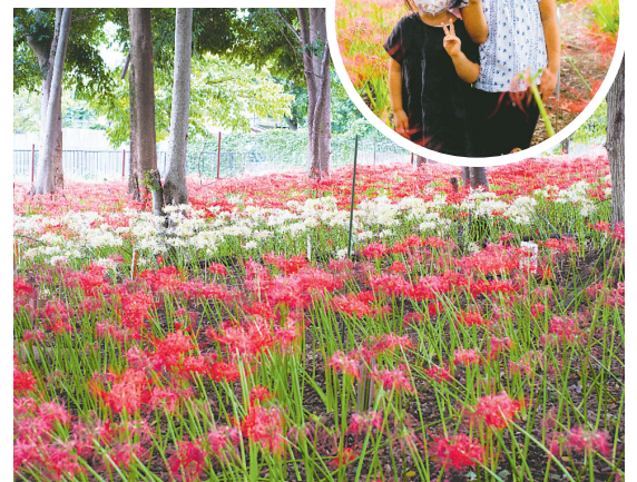
▶所沢牛沼彼岸花クラブが丹精込めて育てた彼岸花が9月下旬に見ごろを迎え、赤と白のコントラストを一目見ようとたくさんの人で賑わっていました。

⚠発熱などの症状がある時、下記休日急患当番医の当番時間外など受診先に迷う場合は、本号4面「発熱などの症状があるとき」をご覧ください。