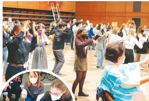
◀イタリア・D'eledda 高校の生徒たちと市内の高校生が10月8日(土)、小手指公民館分館で日本の文化を学ぶ交流会を開催。日本語でのあいさつや、盆踊りなど、日本の文化を楽しみながら体験しました。