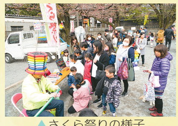
▲ さくら祭りの様子

近年、住宅建設が進み新規転入者が増え人員構成が変化してきた下安松中新井自治会。積極的にイベントなどを開催して交流を図ってきました。特に子どもからお年寄りまでたくさんの参加者が集まる「さくら祭り」や「ハロウィン祭り」は、地域の親睦を深めています。一緒に同じ空間で楽しむことで、地域のことや人を知り、仲間になり、地域に一体感が生まれています。その甲斐あって、積極的に自治会活動に関わる若い人も増えてきました。イベント開催が難しい時期が続きましたが、地域防災など地域の繋がりが見直される今、また以前のようにイベントが開催できる日が待ち遠しいですね。