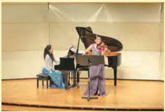
▲ヴァイオリン&ピアノコンサートの様子

2月には「公民館40周年記念音楽会」を開催予定。地区内の中学校・高等学校の吹奏楽部がプロの演奏家とともに登場します。