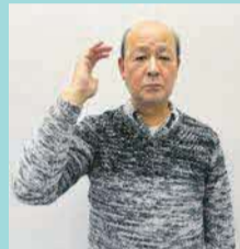
指文字「コ」の形で頭のこめかみのところに持っていく