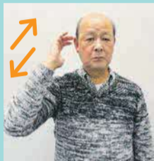
2回ほど少し前後に動かします。