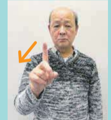
人差し指を立てて、2回ほど左右に動かす