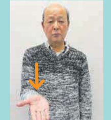
相手に向けて右手を広げる(質問するという意味)